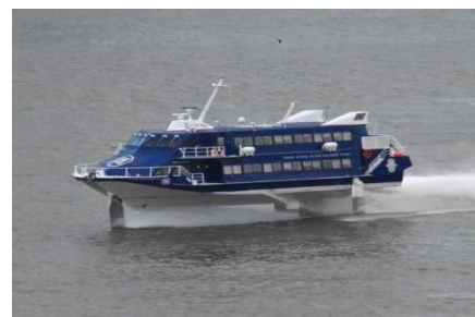
ジェットフォイル 結