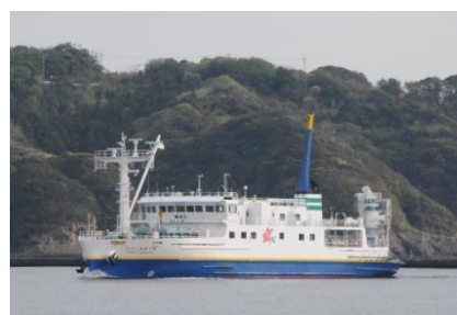
フェリーあぜりあ